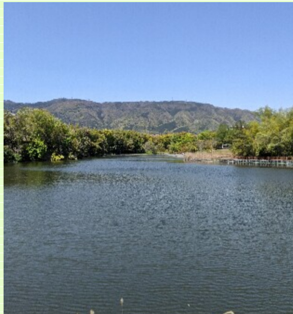
洛西・大蛇が池公園