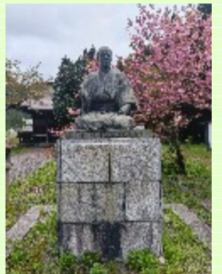
山形県・荘内清川 清川八郎先生の像