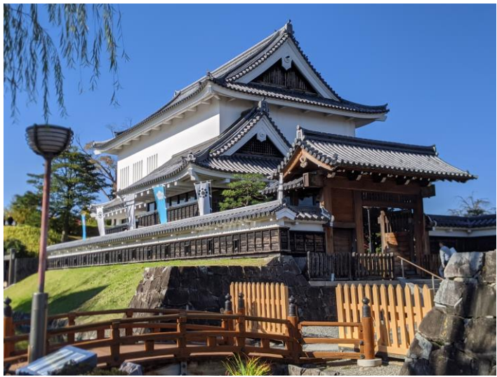
長岡京市・勝龍寺城